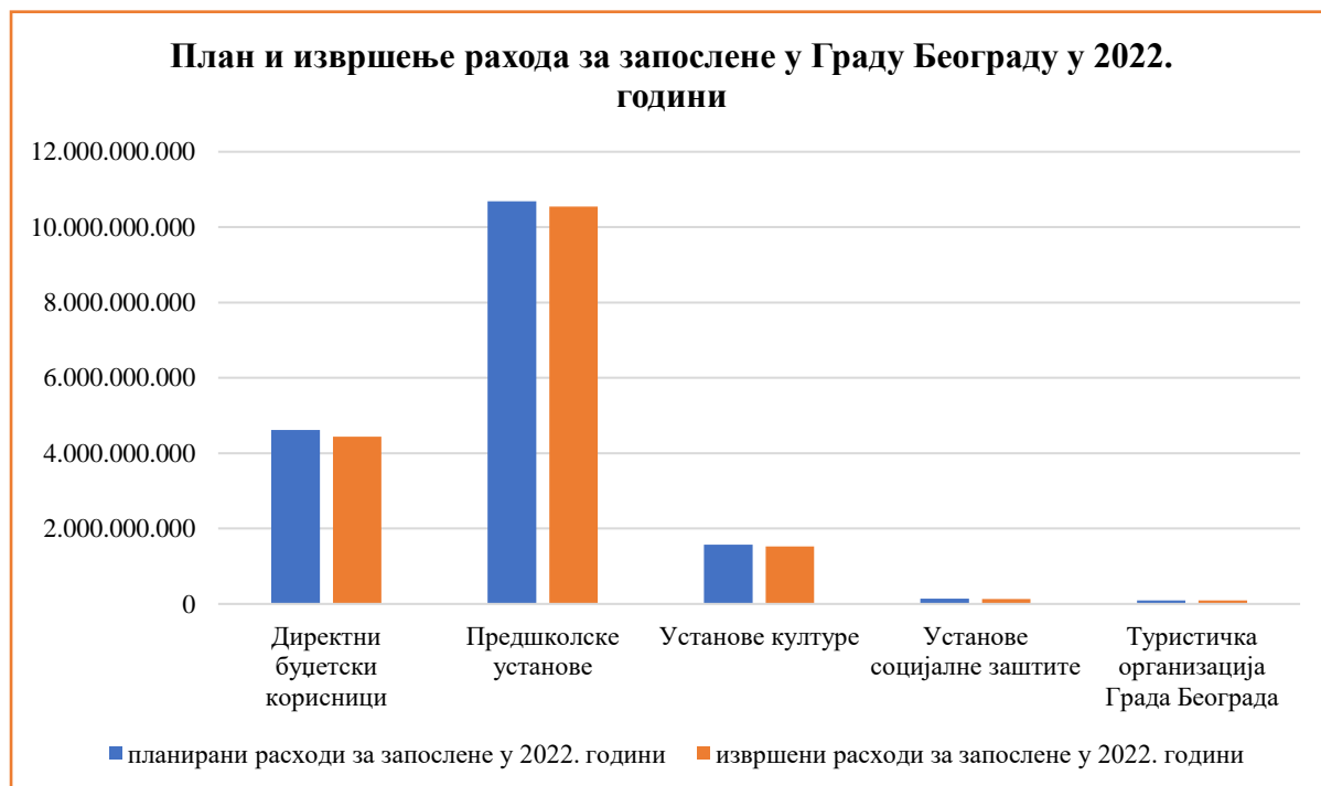
Графикон бр. 1: План и извршење расхода за запослене у 2022. години по корисницима у динарима

У структури расхода за запослене највеће учешће имају плате, додаци и накнаде запослених (група конта 411000) и социјални доприноси на терет послодавца (група конта 412000), а најмање учешће у укупним расходима за запослене имају накнаде трошкова за запослене (група конта 415000).