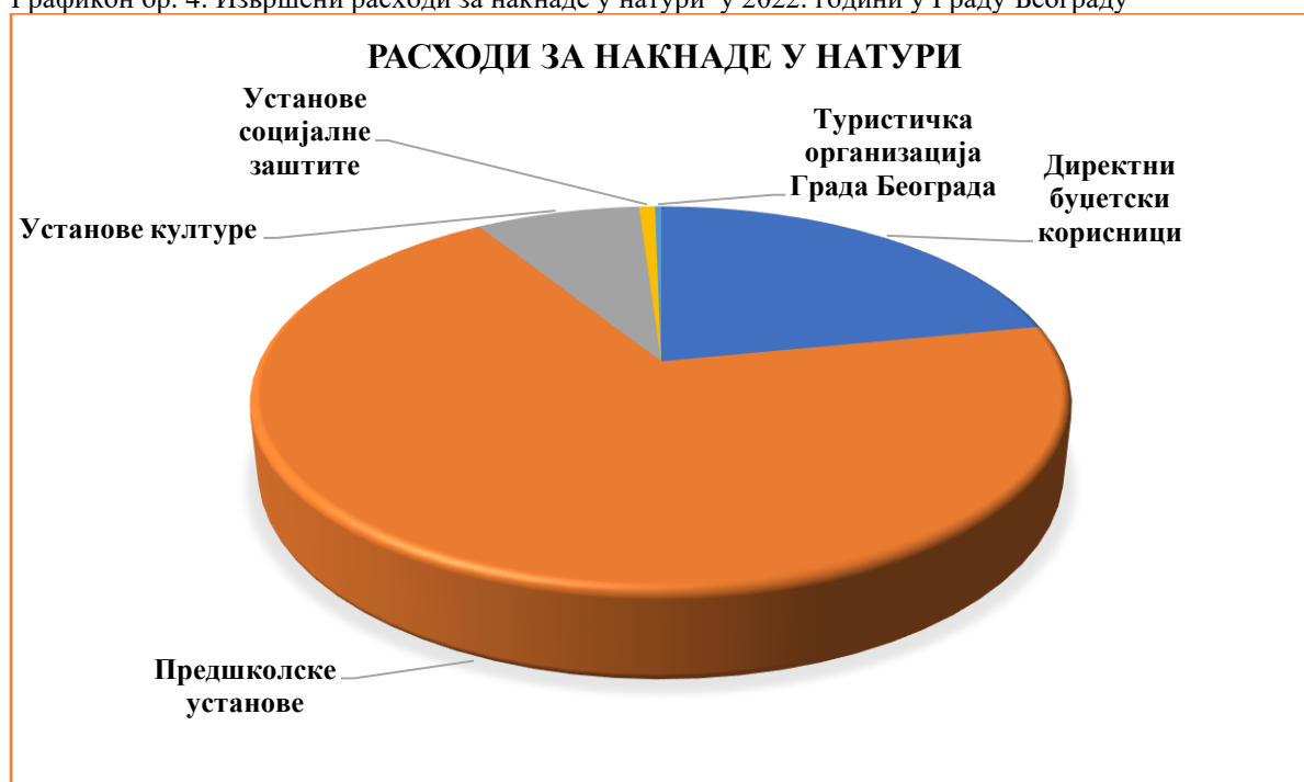
Графикон бр. 4: Извршени расходи за накнаде у природи у 2022. години у Граду Београду

Град Београд је у 2022. години планирао расходе за накнаде у природи у износу од 522.418.403 динара, а извршење ових расхода износило је 505.734.460 динара.