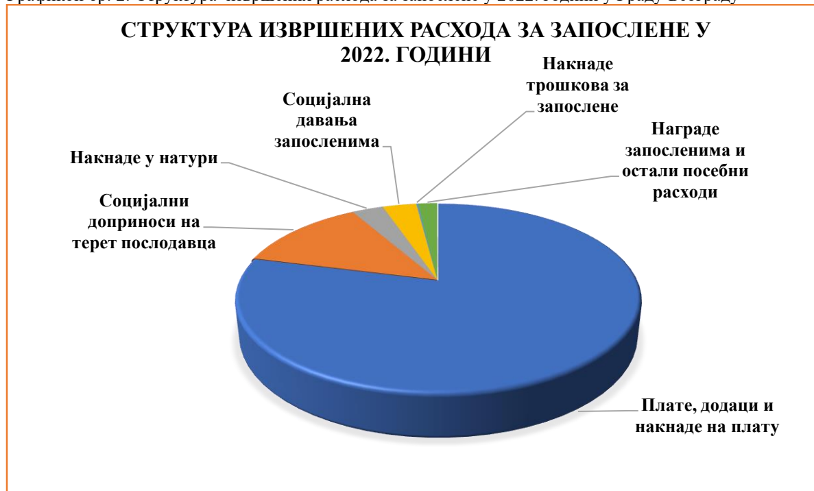
Графикон бр. 2: Структура извршених расхода за запослене у 2022. години у Граду Београду