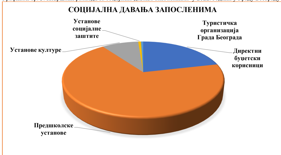
Графикон бр. 5: Извршени расходи за социјална давања запосленима у 2022. години у Граду Београду

Град Београд је у 2022. години планирао расходе за социјална давања запосленима у износу од 567.246.689 динара, а извршење ових расхода износило је 541.492.320 динара.